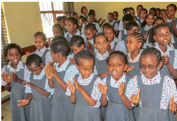
Mit großer Freude nehmen die Jungen und Mädchen am Musikunterricht teil.

Mangelernährung, Infektionskrankheiten und unzureichende medizinische Versorgung sind die häufigsten Gründe, warum Kinder mit Behinderungen geboren