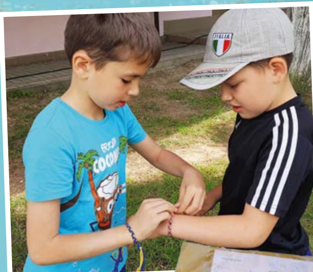
Bänder der Freundschaft: Wir wünschen uns Frieden in der Ukraine und weltweit.

Übrigens: Beim Neujahrsgottesdienst haben die Sternsinger Papst Franziskus eins der Armbänder aus der Ukraine überreicht.